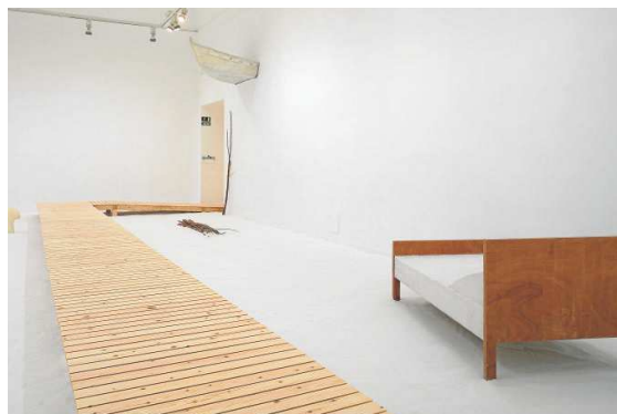
Sobre estas líneas, y a la derecha, detalle del montaje de las obras donadas por Eva Lootz al Museo Reina Sofía